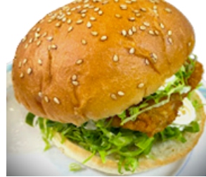
アジフライバーガー 900円