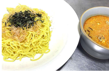
デビルチキンつけ麺 1,300円