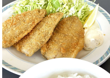
アジフライ定食 1,300円