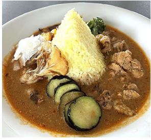
デビルチキンカレー 1,400円