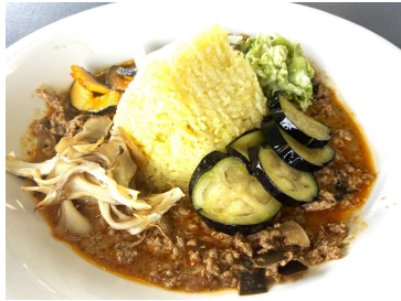
デビルキーマカレー 1,400円