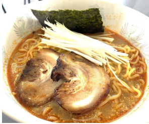
デビルチキンラーメン 1,300円